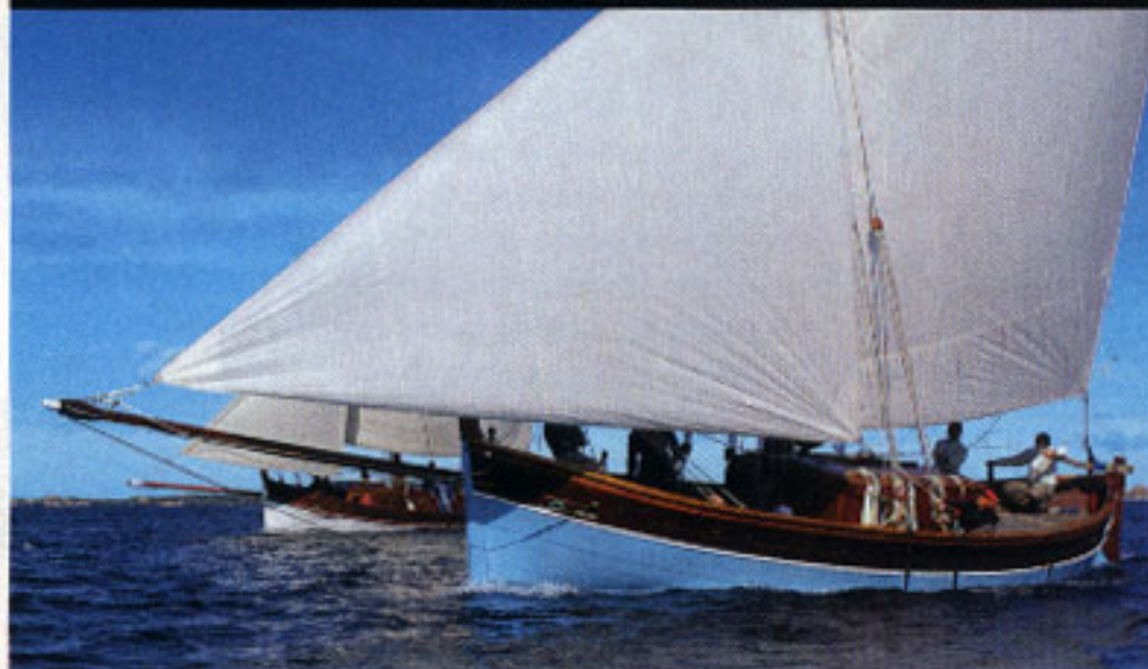
Due momenti di navigazione a bordo del gozzo da pesca Lybra.